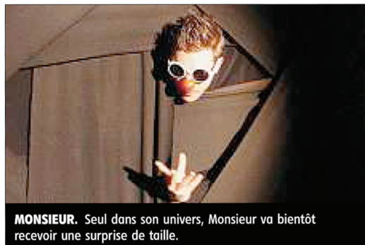
MONSIEUR. Seul dans son univers, Monsieur va bientôt recevoir une surprise de taille.

Et les enfants ont bel et bien répondu à l'appel dimanche à la salle des fêtes de Saint-Bonnet-de-Bellac qui était archi-comble !